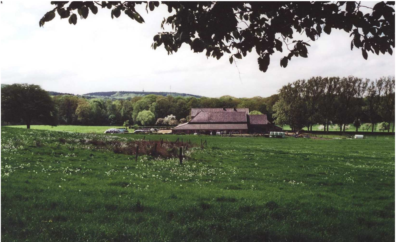
Gut Waldhausen von Osten gesehen

Der Gutshof Waldhausen wurde nach einer Datierung in einem Keilstein 1799 erbaut. Er bestand ursprünglich aus einem zweigeschossigen Wohnhaus und dem Wirtschaftsgebäude aus Backstein mit Blausteingewänden. In der Mitte des zwanzigsten Jahrhunderts wurden beide Gebäudeteile verbunden zu einer dreiflügeligen Hofanlage. Der Hof wird noch immer als landwirtschaftlicher Betrieb geführt.