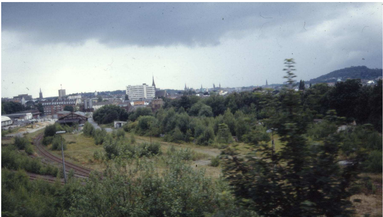
Moltkebahnhof vor dem Bau der Gesamtschule von der Bahnlinie Aachen Köln aus gesehen

Dieser Bahndamm schneidet das Frankenberger Viertel von der Frischluftschneise des Bachtals ab. Die Bachtäler sind wichtig im Aachener Talkessel für die Versorgung der Innenstadt mit Frischluft. An heißen Sommertagen wälzt sich die frische Kaltluft aus der Umgebung entlang der Bäche in Richtung Innenstadt. Am Gillesbach kann man besonders gut erleben, wie sich an heißen Sommerabenden vor dem Bahndamm ein „Frischluffsee“ bildet. Es fühlt sich an, als tauche man in kaltes Wasser, wenn man sich dem Gillesbachtal nähert. Lange wurde darüber diskutiert, ob es sinnvoll sei, den Bahndamm auf einer längeren Strecke zu öffnen, um das dahinter liegende eng bebaute Wohnviertel optimaler mit Frischluft zu versorgen. Wegen unabsehbar hoher Kosten wurden diese Pläne aufgegeben zumal die Wirkung durchaus umstritten war.