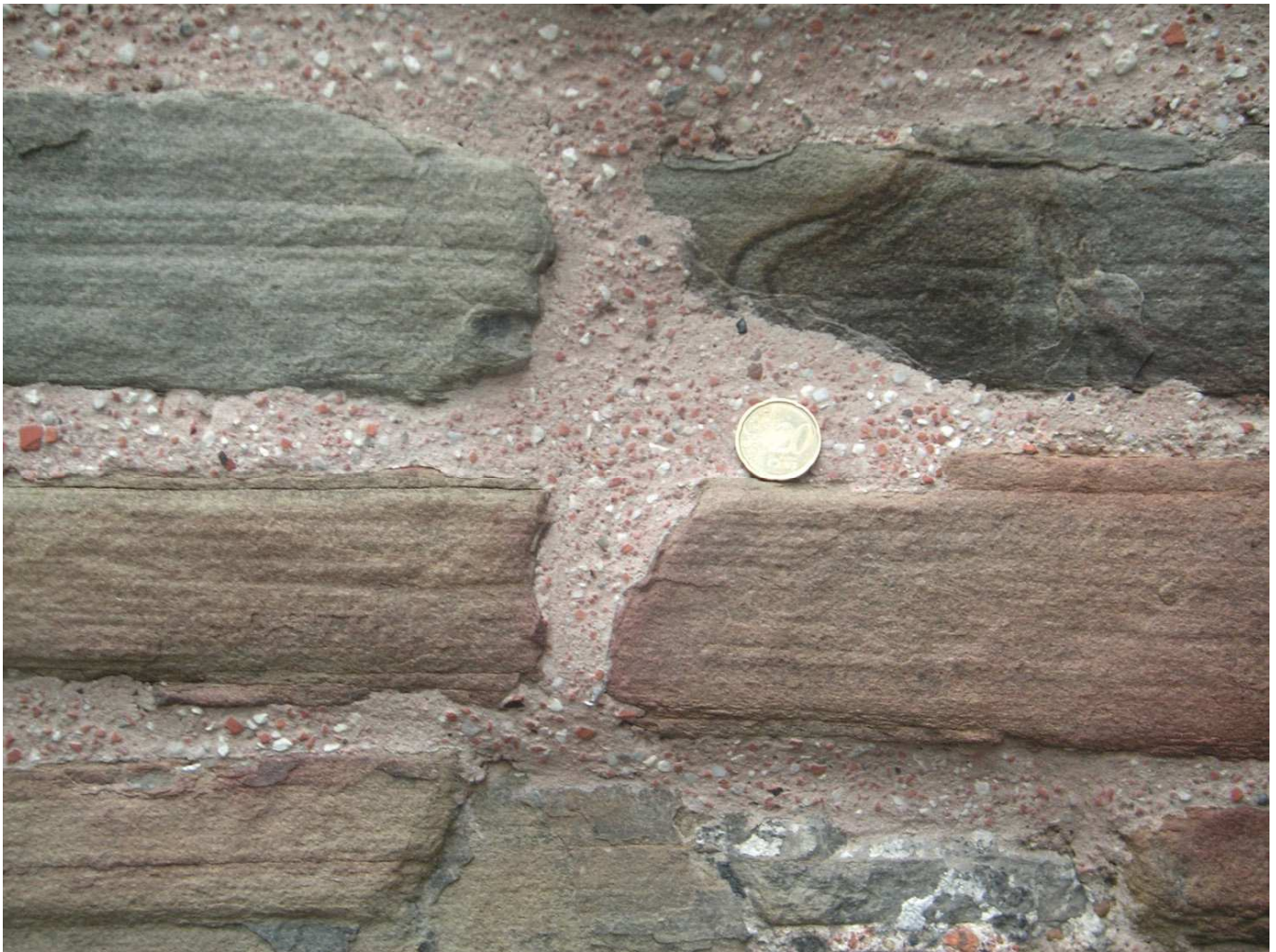
Abb. 2: Feingeschichteter Sandstein aus der Zeit des Oberdevons im Mauerwerk des Oktogons. Kaiser Karls Bauarbeiter haben diesen relativ dünnplattigen und eisenhaltigen Stein vermutlich in der Nähe des Adalbertsbergs gebrochen. Im Mörtel des Oktogons findet man zermahlene römische Backsteine als Zuschlagsstoff (20 Cent-Münze als Maßstab).

Sandstein besteht aus groben oder feinen Sandkörnern. Meist überwiegt Quarz, Siliciumdioxid, \text{SiO}_2 , ein sehr hartes und dauerhaftes Mineral. Daneben können auch Körner aus Feldspat oder andere Bestandteile wie Tonminerale darin vorkommen. Sandstein kann aus groben, deutlich erkennbaren Körnern bestehen, die im auftreffenden Licht glitzern, aber auch aus sehr feinen und mit bloßem Auge kaum erkennbaren Sandkörnern. In Sandstein ist oft eine Schichtung erkennbar. Feinen, dünn geschichteten und durch Erdkräfte gefalteten Sandstein findet man in Aachen sehr gut sichtbar am Adalbertsfelsen. Die Schichten des Condrosandsteins stammen aus der Zeit des Devons vor ca. 350 Millionen Jahren und wurden in einem flachen Meer abgelagert. Körnige Sandsteine sieht man in den bekannten Buntsandstein-Felsen von Nideggen in der Eifel (ca. 225 Millionen Jahre, hier mit großen Geröllen aus Quarzit). Die Zyklopensteine im Aachener Wald bestehen aus Sandstein aus der Kreidezeit vor ca. 80 Millionen Jahren.