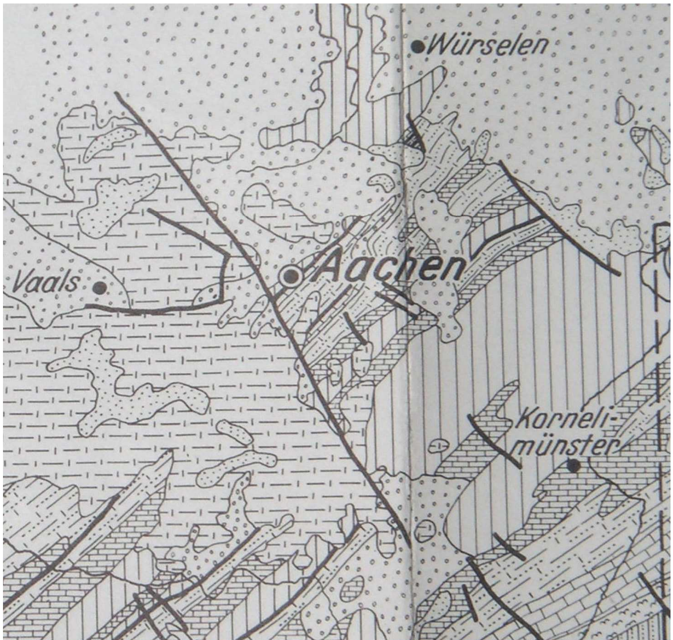
Abb. 1: Die Schraffuren der geologischen Karte zeigen ein Mosaik unterschiedlicher Schichten im Aachener Untergrund. Es überwiegen Sand- und Kalksteine aus dem Erdaltertum (Devon ca. 400 Mio. Jahre, Karbon ca. 300 Mio. Jahre alt), die in südwest-nordöstlicher Richtung verlaufen, und darüber ausgebreitete Schichten aus dem Erdmittelalter (Zeit der Oberkreide, etwa 80 Mio. Jahre). Aus: Richter, D. (1985).

Aachen verfügt über eine Reihe von Flurnamen mit geologischem Bezug, so z.B. Sandkaulstraße (Sandgrube in den Sanden der Kreidezeit), Steinkaulstraße (Steinbruch mit Sandsteinen und Quarziten aus der Zeit des Karbon), Rütcher Straße (offene, sandige und steinige Flanke des Lousbergs, von Rötsch, Röß oder Rütch für „steinige Fläche“, wie in frz. Roche oder it. Roca) und schließlich Rothe Erde (ein bereits vor der Industrialisierung bestehender Flurname, der sich auf den intensiv roten Verwitterungslehm über dem Karbon-Kalk bezieht). Schwer zu beschaffen und mühevoll zu transportieren, war dieser Naturstoff ein wertvolles Gut, so wertvoll, dass man auch die Reste antiker Ruinen abtrug und wieder verwendete, wie dies z.B. bei der Errichtung des Aachener Doms geschah. Welche häufigsten Gesteinsarten gibt es, und welche begegnen einem in Aachen und Umgebung?