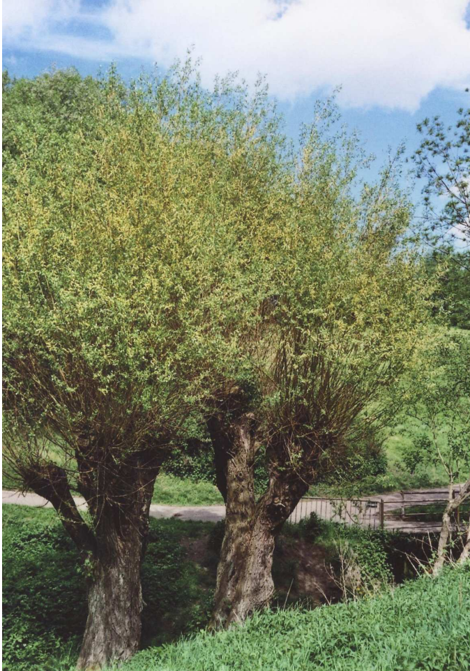
Kopfweiden am Gillesbach