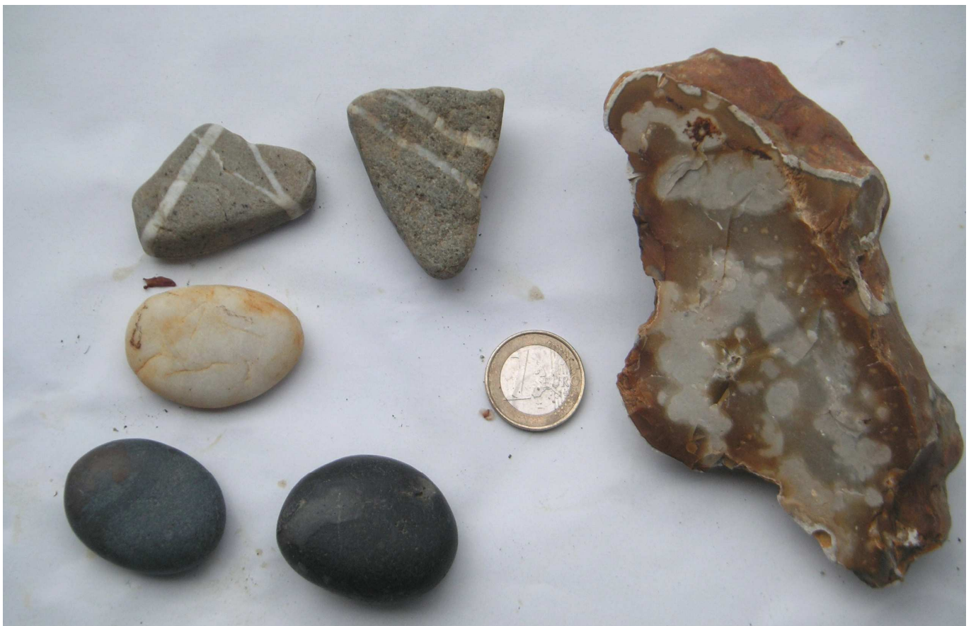
Abb. 3: Woraus besteht Kies? Oben zwei Kiesel aus unterdevonischem Quarzit mit Quarzadern, in der Mitte ein weißes Geröll aus reinem Quarz, das aus der Verwitterung einer dickeren Quarzader stammt. Unten zwei fast schwarze, sogenannte Kiesel-schiefer, eine Art Feuerstein aus dem Erdaltertum (Karbon). Rechts ein großer Feuerstein des Tertiärs (50 Mio. Jahre).

Quarzit ist das Gestein, aus dem viele Flusskiesel von Rur, Rhein und Maas bestehen. Quarzit war einmal ein Sandstein, in dem sich die Körner zu einer sehr harten dichten Masse verbunden haben, und besteht fast nur aus dem Mineral Quarz. Er wird oft von weißen Adern aus reinem Quarz durchzogen, der auf den Kieselsteinen die schönen Streifen bildet. Die Quarze und Quarzite, die man auf Aachener Gebiet findet, stammen aus der Eifel, dem Hohen Venn und dem Rheinischen Schiefergebirge. Viele sind sogar vom Taunus und dem Hunsrück hierher geschwemmt worden und mehrere Hundert Millionen Jahre alt. Geht man im Hohen Venn oder rund um Mützenich spazieren, dann sieht man oft die sogenannten Vennwacken, die wie kleine Findlinge dort verstreut sind (z.B. Kaiser Karls Bettstatt). Sie sind die Reste von Quarzitbänken, die sich durch den uralten Schiefer aus der Kambrium-Zeit (500 Mio. Jahre) ziehen und wegen ihrer Härte sehr widerstandsfähig gegen die Einwirkungen der Zeit und der Verwitterung sind. Später wurden sie während kalter und niederschlagsreicher Zeiten von Flüssen abgetragen und zu Kieseln abgerollt. Diese großen Wildflüsse, die Vorgänger von Rhein und Maas, breiteten vor der Eiszeit eine dicke Schicht von Kies über die ganze Niederrheinische Tiefebene, die bis heute in zahlreichen Kiesgruben abgebaut und zu barem Geld gemacht wird.