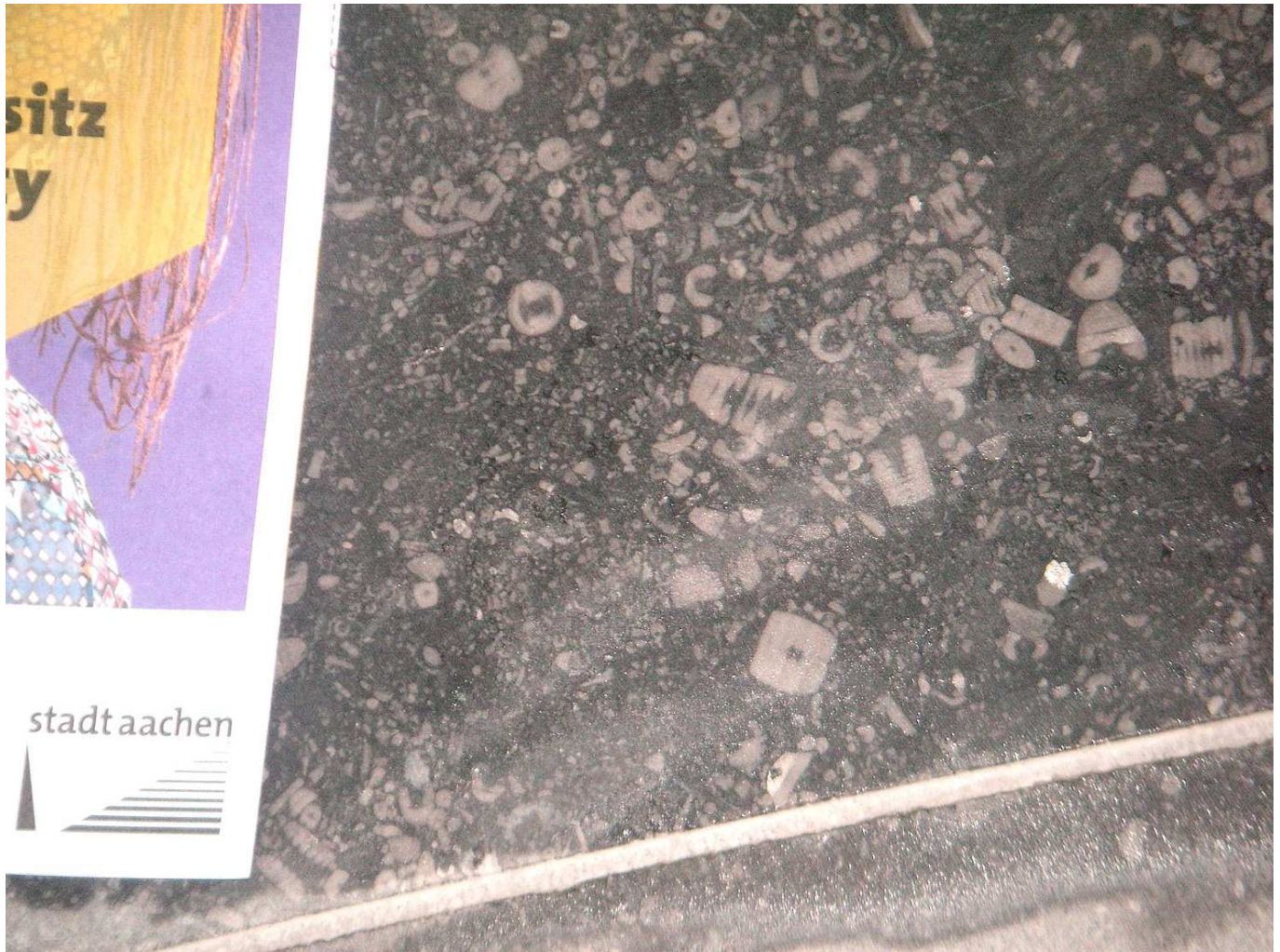
Abb. 4: Fossilreicher Blaustein oder Kohlenkalk vom Boden des neuen Verwaltungsgebäudes am Katschhof. In der Grundmasse sind die einzelnen Stielglieder zerfallener See-Lilien erkennbar. Diese planktonfressenden Tiere gehören zu den Stachelhäutern und bevölkerten in Massen den Meeresboden.