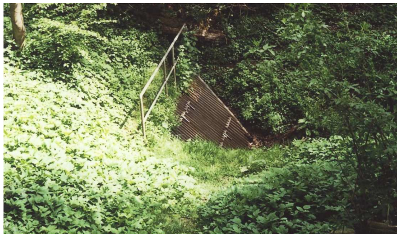
Hier verschwindet der Gillesbach unter dem Bahndamm

Folgt man ab der Brücke dem Weg links entlang des Bachs so trifft man am Ende die Stelle, wo der Bach in einem Gitter unter dem Bahndamm der Strecke Aachen Köln verschwindet. Das letzte Stück seines Wegs verbringt der Gillesbach in Rohren, bis er schließlich in die Wurm mündet.